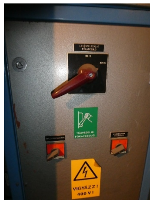
2. kép: A lépcsőházankénti tűzeseti főkapcsoló