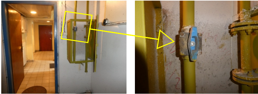
3. kép: A lépcsőházankénti gáz főelzáró csap